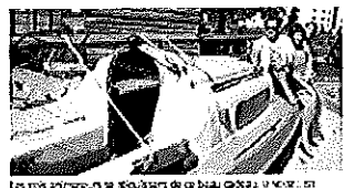
Les participants se retrouvent de nouveau à Sion.

Les organisateurs de la Journée de clôture du Tipt Tenain d'Aventure ont organisé une belle manifestation. Les participants ont pu profiter de nombreuses activités. Le conseil municipal a approuvé le budget pour l'année 2013.