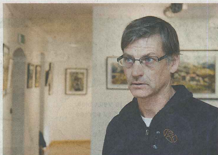
Dominique Lugon avait déjà exposé ses toiles à la tour Lombarde,

Il a commencé dans cette veine il y a deux ans. «L'abstraction révèle plus l'individu», estime-t-il. Toujours, dans ses huiles sur toile, la révélation d'une impression, de poétisation, le souci de l'esthétisme, le soin de la cou-